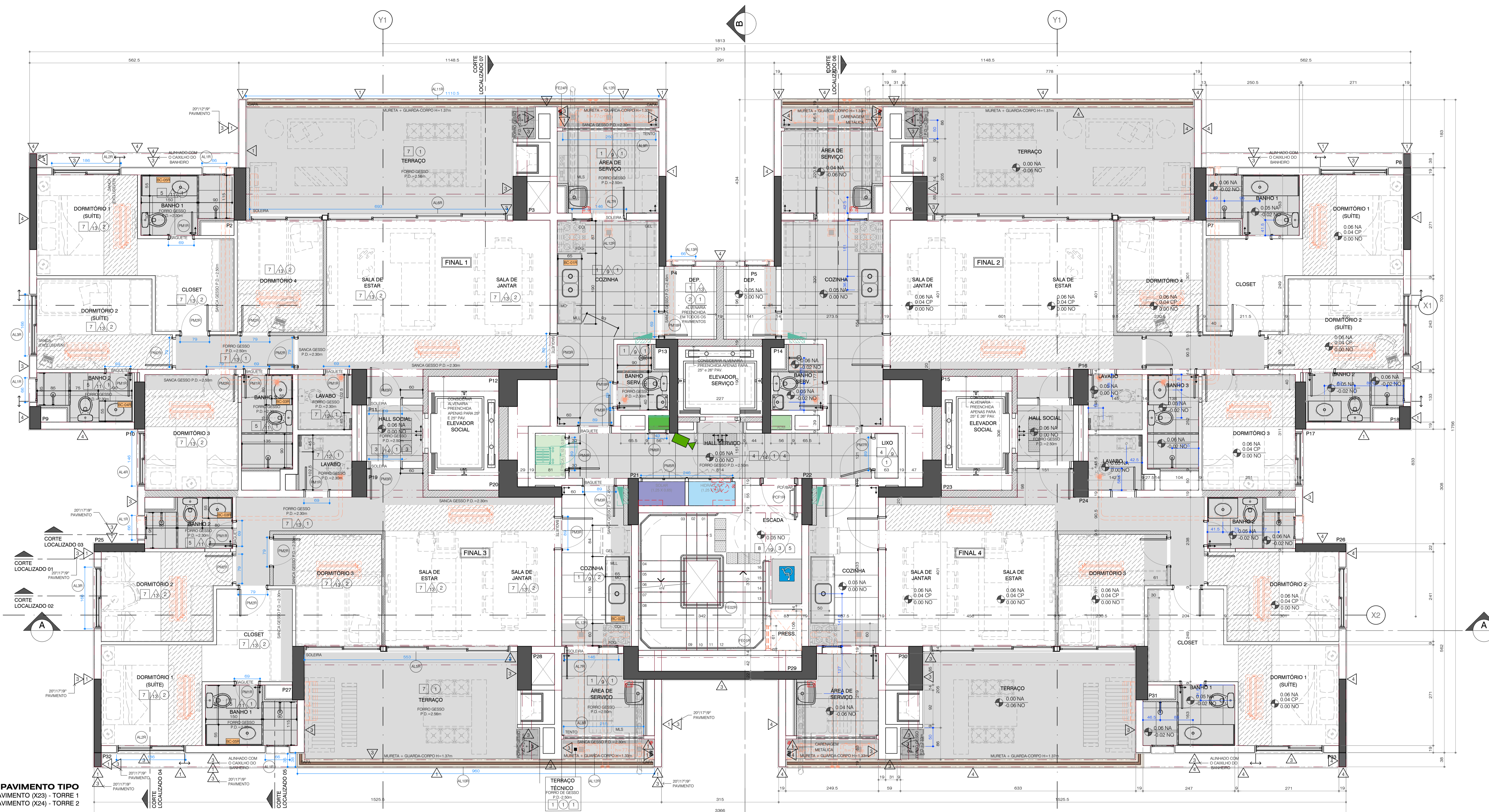
PLANTA PAVIMENTO TIPO 4º AO 26º PAVIMENTO (X23) - TORRE 1 3º AO 26º PAVIMENTO (X24) - TORRE 2 ESCALA 1:50